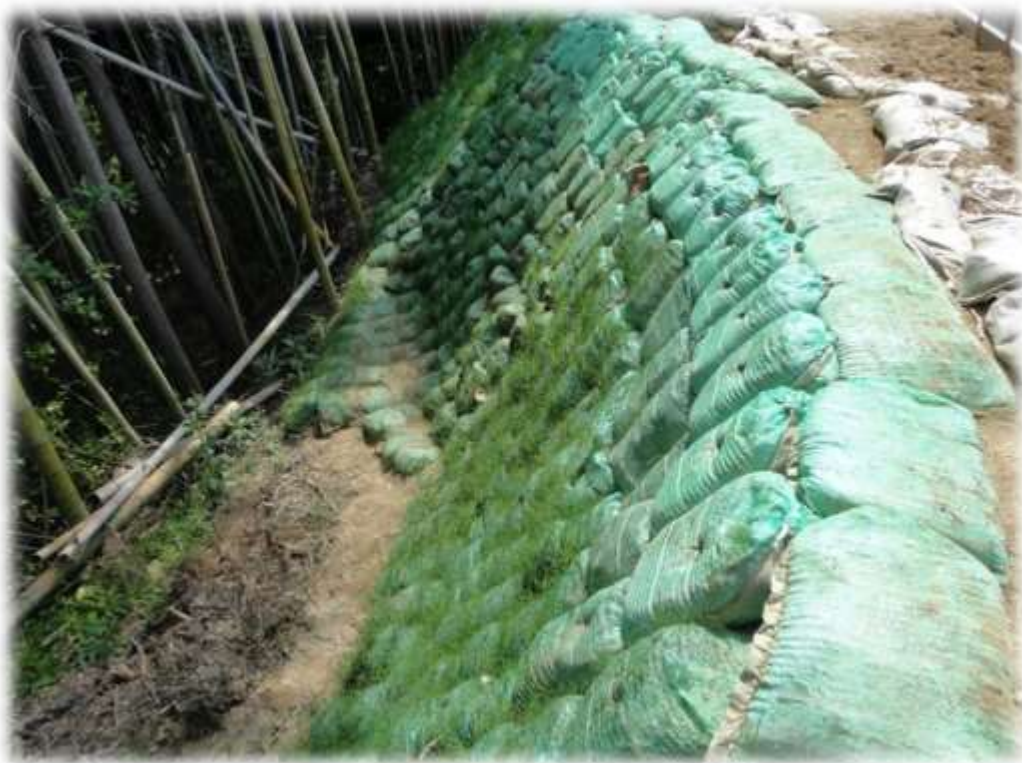
Bao thực sinh Greenbag