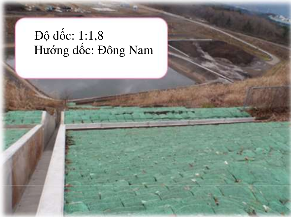
Bao thực sinh Greenbag