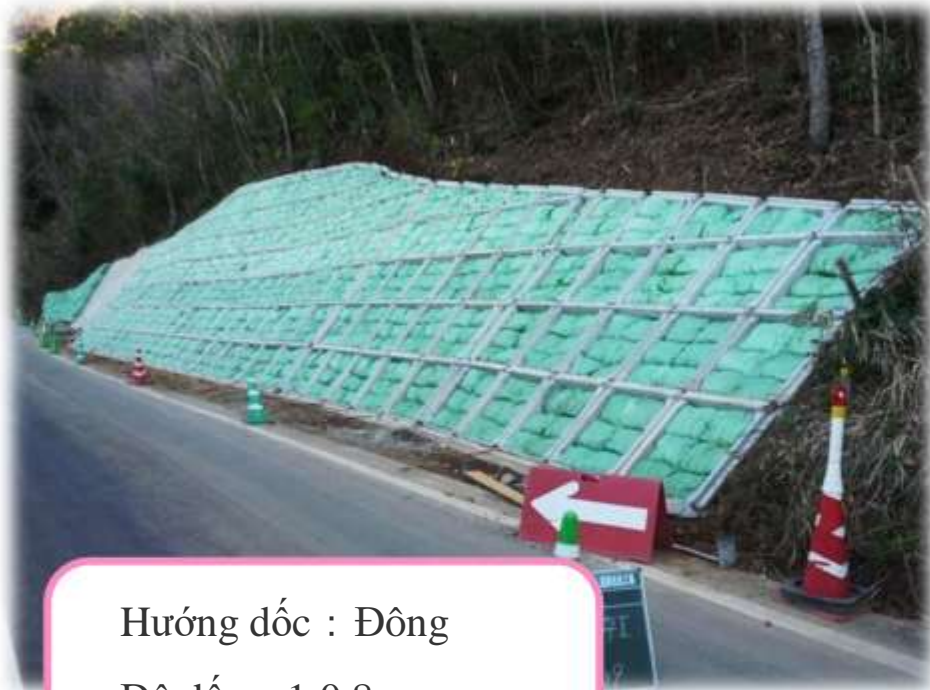
Sau thi công